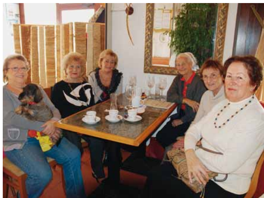
«Les Baladines» se retrouvent tous les samedis matins au restaurant du tennis club.

été partenaires de tennis et ensuite... partenaires pour la vie!