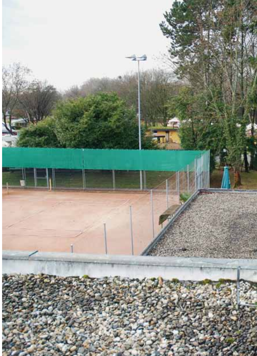
Le TC Morges rêve d'un futur club-house sur les toits, avec vue sur le lac.

Si l'espace membre se fait attendre, les Dinosaures et les Baladines, n'attendent pas sa construction pour se retrouver, toutes les semaines autour d'un bon verre... mais il faut le mériter et... avoir d'abord usé ses semelles sur les courts!